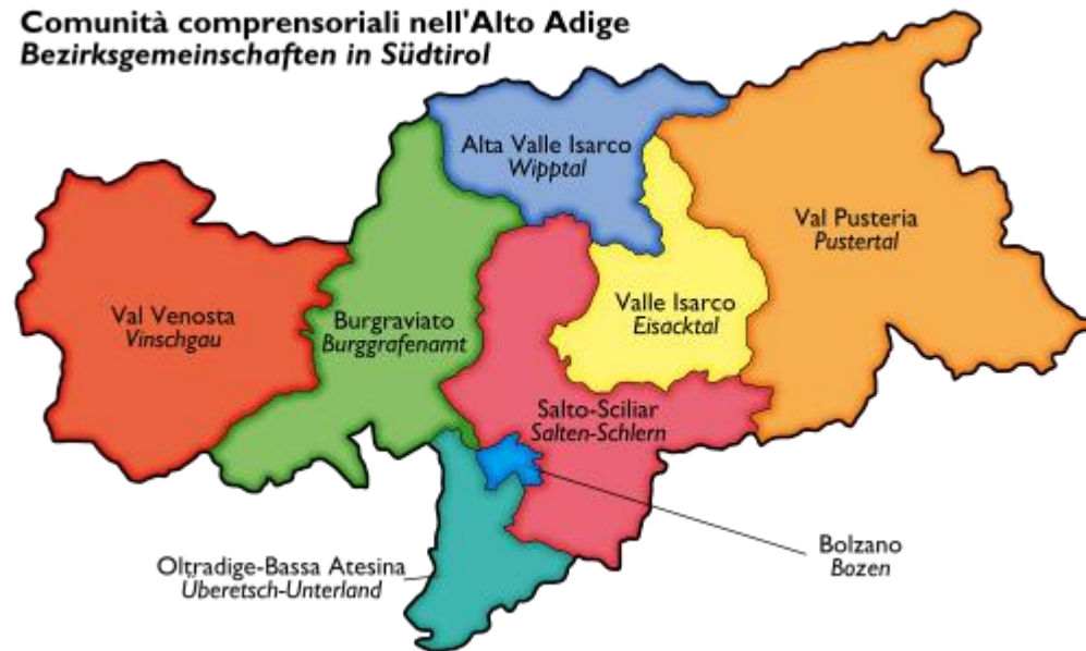
Comunità comprensoriali nell'Alto Adige Bezirksgemeinschaften in Südtirol